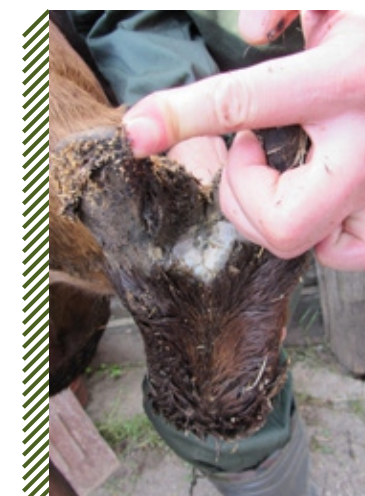
Поражение кожных покровов межкопытцевой щели