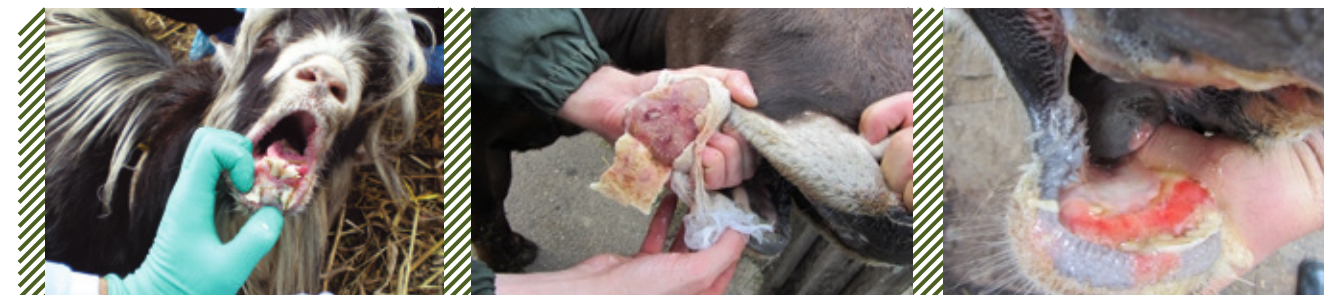
Поражение слизистой оболочки ротовой полости и языка