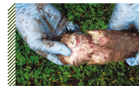
Поражение кожных покровов венчика и межкопытцевой щели