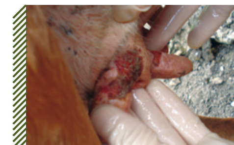
Везикулярные поражения кожных покровов сосков вымени