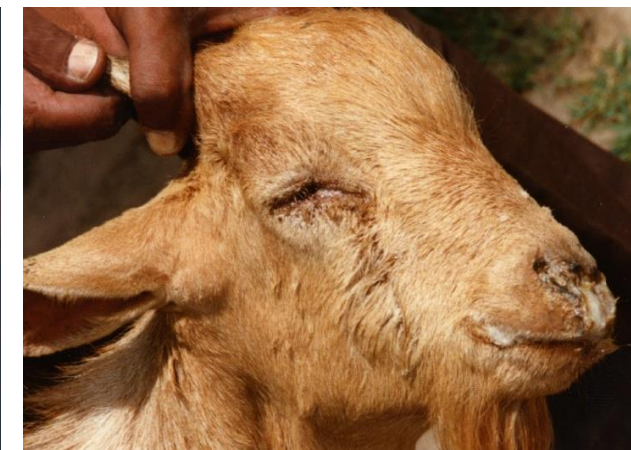
Выделения из глаз, носа и рта