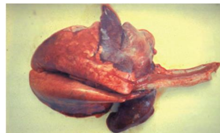
Застойные явления долей легких.