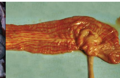
Толстая кишка, с полосами кровоизлияний («полоски зебры») на складках слизистой оболочки.