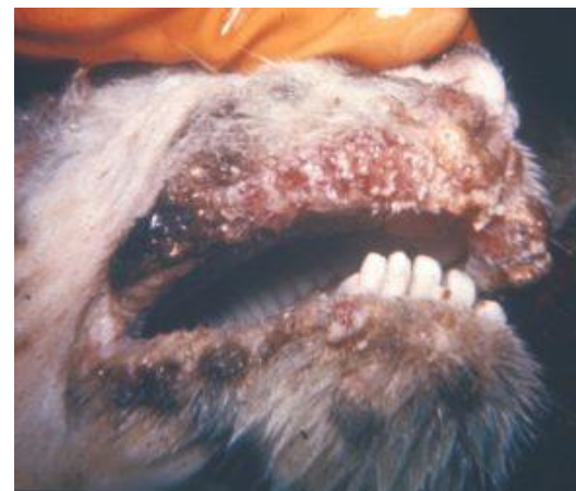
Эрозивные поражения ротовой полости

Профилактика основана на комплексе мероприятий по предотвращению заноса заболевания в РФ.