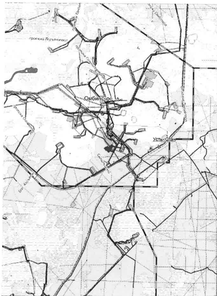
Схема размещения объекта: «Обустройство куста скважин № 11у Омбинского месторождения»

Приложение № 1 к постановлению администрации Нефтеюганского района от 01.09.2020 № 1281-па