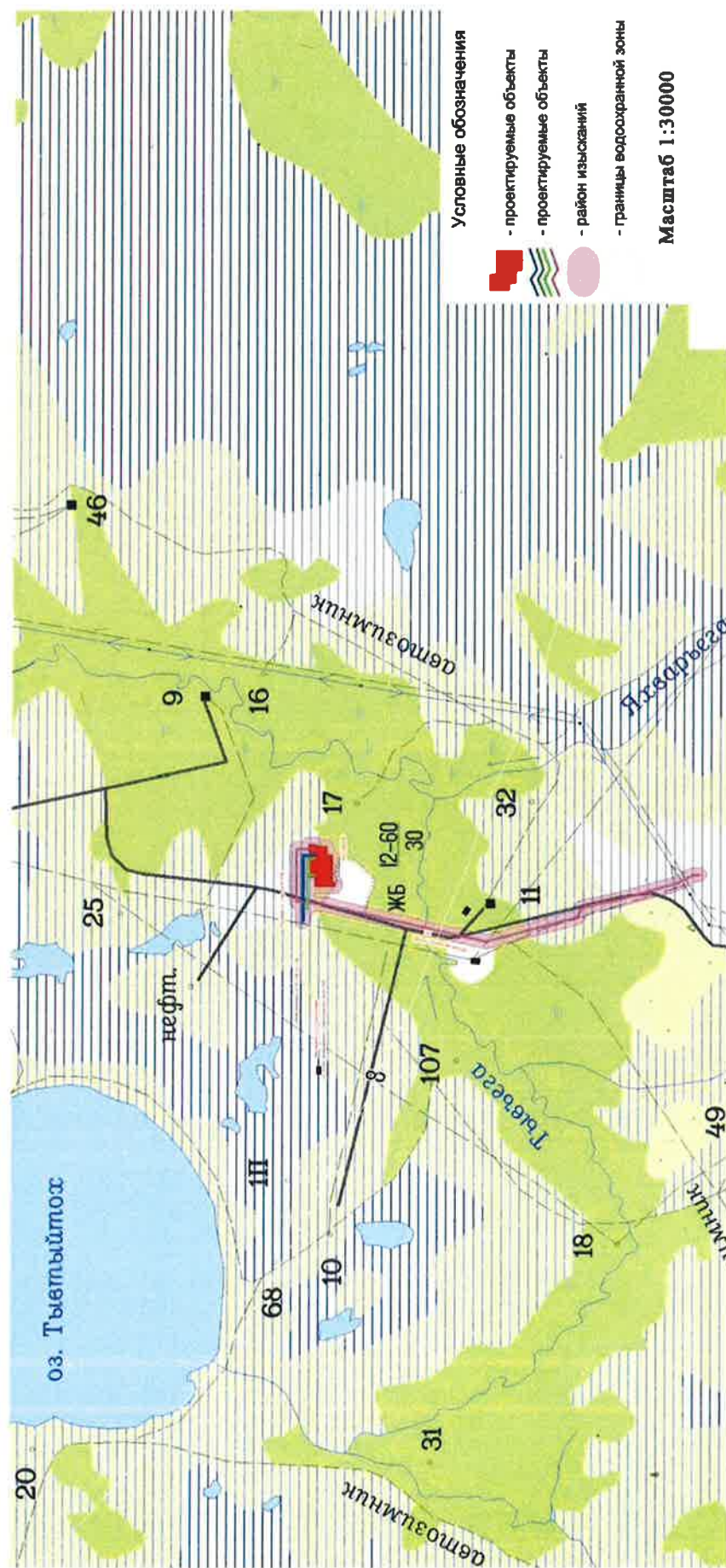
СХЕМА размещения объекта: «Обустройство куста скважин № 108 Лемпинской площади Салымского месторождения»

Приложение № 2 к постановлению администрации Нефтеюганского района от 22.02.2018 № 262-кв