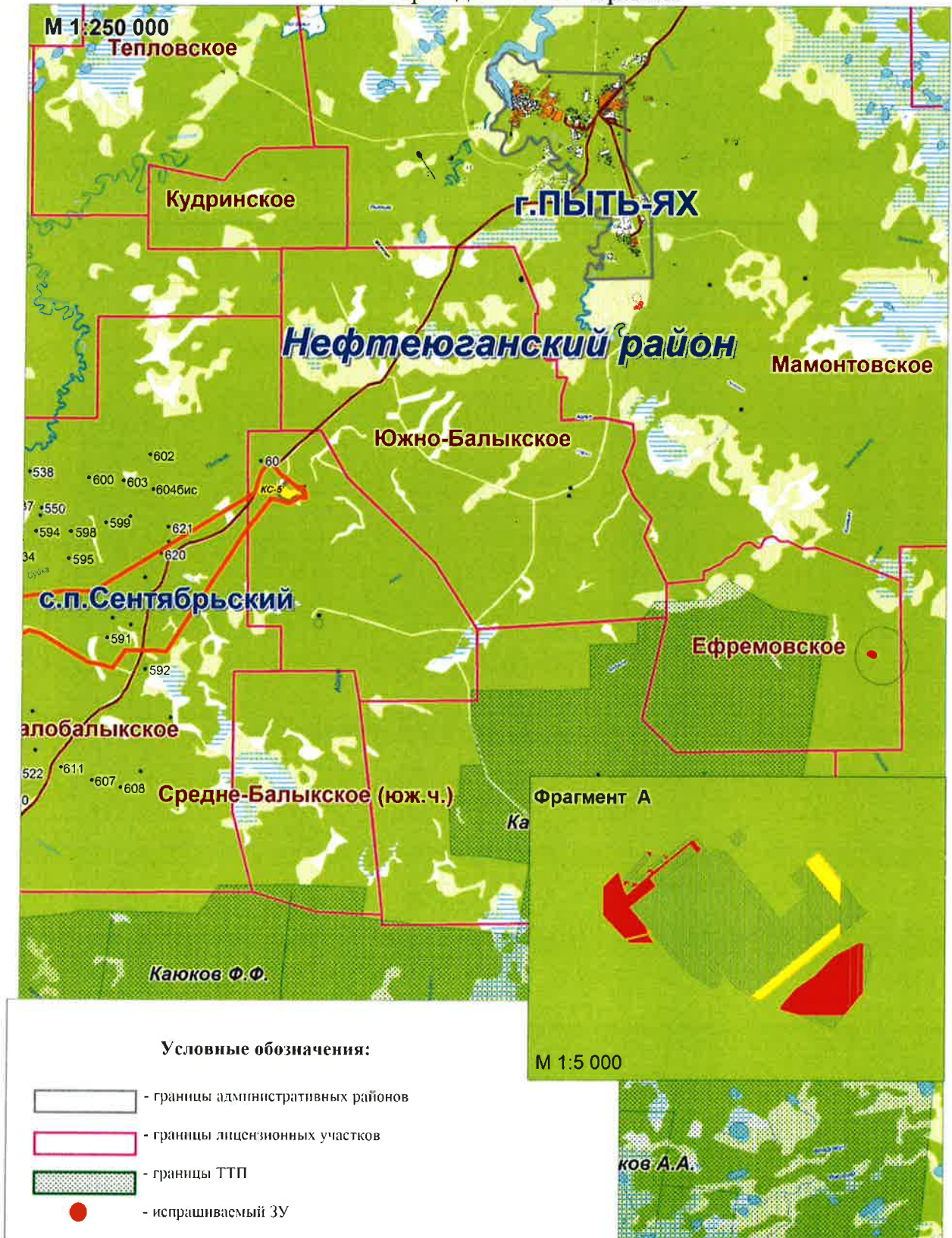
Схема размещения объекта: «Обустройство куста скважин № 105 Ефремовского месторождения. Расширение»

Приложение № 3 к постановлению администрации Нефтеюганского района от 10.10.2018 № 1708-пс