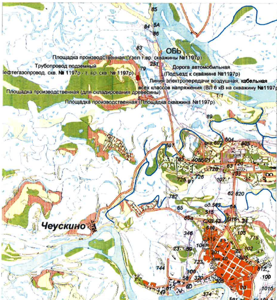
Схема размещения объекта: «Обустройство разведочной скважины № 1197р Солкинского месторождения, Юганского региона»